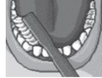
K = iđneme yzeyleri

(K = iđneme yzeyleri, A = Diř yzeyler, I = İ yzeyler)