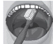
I = İ yzeyler